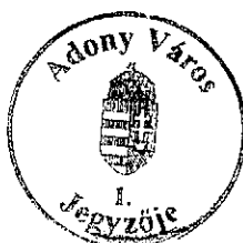
Földi Ilona aljegyző